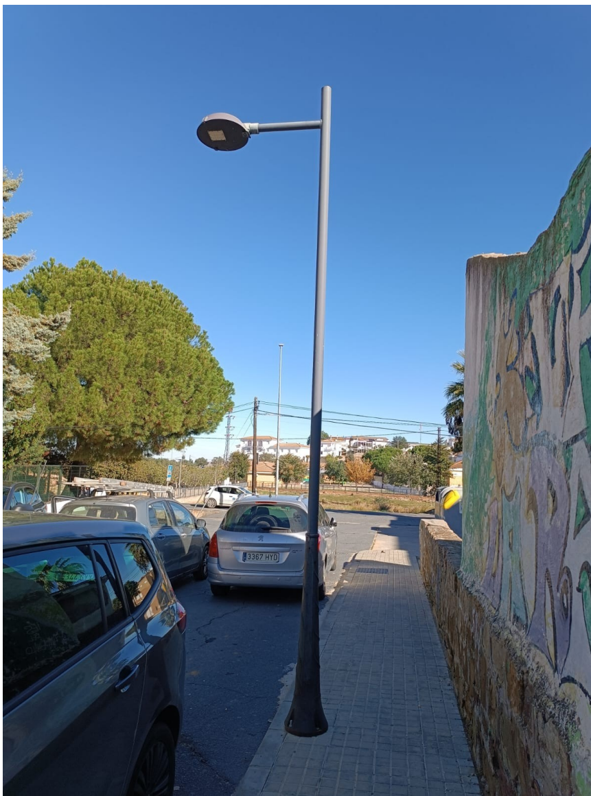
FAROLA MODELO AYUNTAMIENTO DE PUEBLA DE GUZMÁN